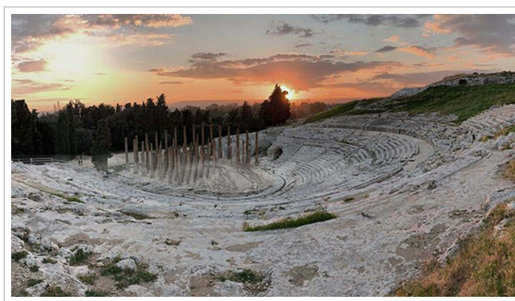
Stefano Boeri Architetti Progetto scenico per Le Troiane di Euripide - Foto dal sito Stefano Boeri Architetti

Il film racconta dei 400 tronchi di abete, violentemente abbattuti in Friuli nell'ottobre 2018 in seguito a una catastrofe ambientale, che approdano a una seconda vita sul palco del teatro greco di Siracusa nella scenografia della tragedia di Euripide firmata da Stefano Boeri